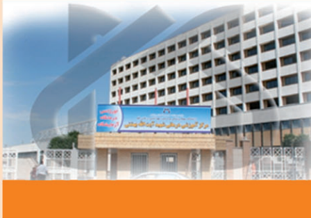
Shahid Beheshti Medical and Education Center

دا نگاه علوم پزشکی و خدمات بهداشتی درمانی قم