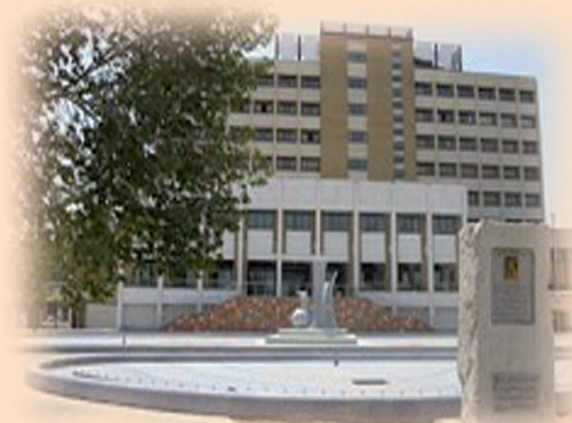
Shahid Beheshti Medical and Education Center