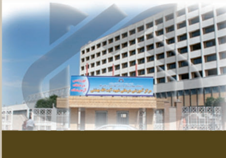
Shahid Beheshti Medical and Education Center

دانشگاه علوم پزشکی و خدمات بهداشتی درمانی قم