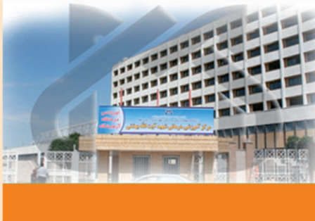
Shahid Beheshti Medical and Education Center

دانشگاه علوم پزشکی و خدمات بهداشتی درمانی قم