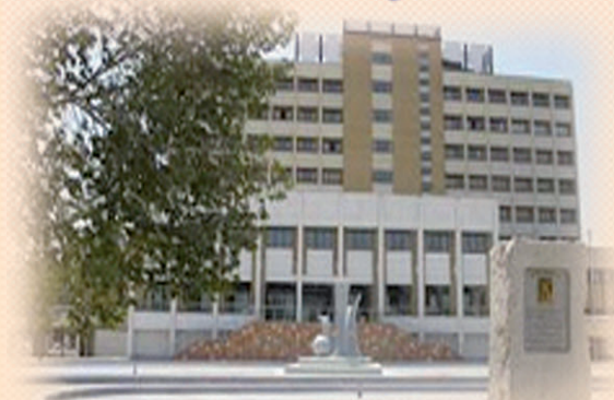
Shahid Beheshti Medical and Education Center