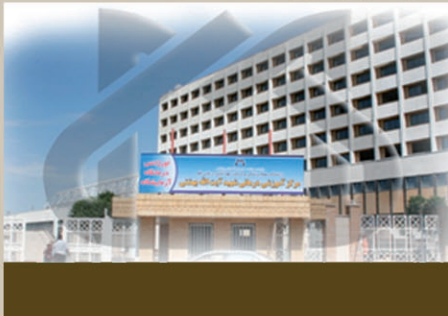
Shahid Beheshti Medical and Education Center

دانشگاه علوم پزشکی و خدمات بهداشتی درمانی قم