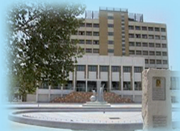
Shahid Beheshti Medical and Education Center