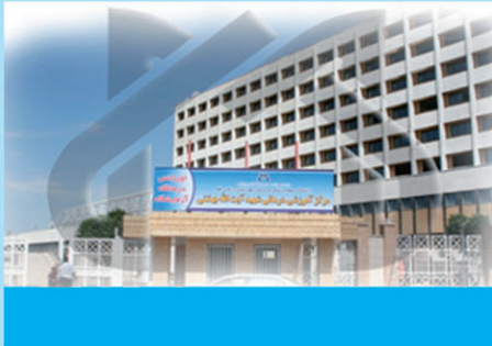
Shahid Beheshti Medical and Education Center

دانشگاه علوم پزشکی و خدمات بهداشتی درمانی قم