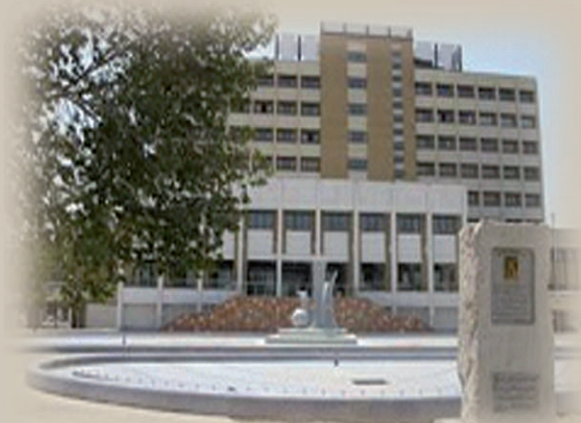
Shahid Beheshti Medical and Education Center