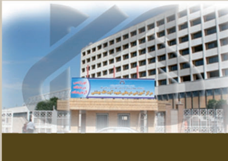
Shahid Beheshti Medical and Education Center

دانشگاه علوم پزشکی و خدمات بهداشتی درمانی قم