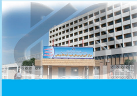
Shahid Beheshti Medical and Education Center

دانشگاه علوم پزشکی و خدمات بهداشتی درمانی قم